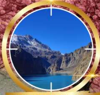
GUPIS ATTABAD LAKE